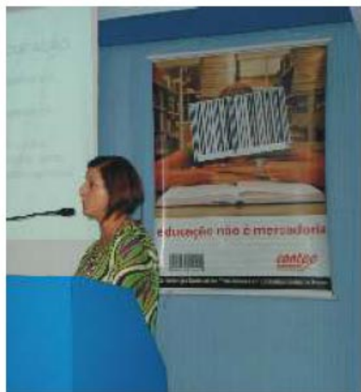
Dia 20 de setembro, em Tubarão.

O pontapé inicial que marcou a primeira atividade de lançamento regional da Campanha foi no Estado do Mato Grosso. Por lá o debate aconteceu no dia 18 de junho, em audiência pública realizada pelo deputado Alexandre César (PT), na Assembléia Legislativa do Estado, com o apoio do Sindicato dos Trabalhadores em Estabelecimentos de Ensino de Mato Grosso (Sintrae/MT). Durante a audiência, que teve a participação de representantes de órgãos públicos e privados, foram formalizadas algumas propostas a serem encaminhadas ao Ministério da Educação, dentre elas a que limita o capital financeiro e franquias para as escolas e a que coíbe cursos a distância. Na sequência, foi a vez da Região Norte realizar um rico debate. Nos dia