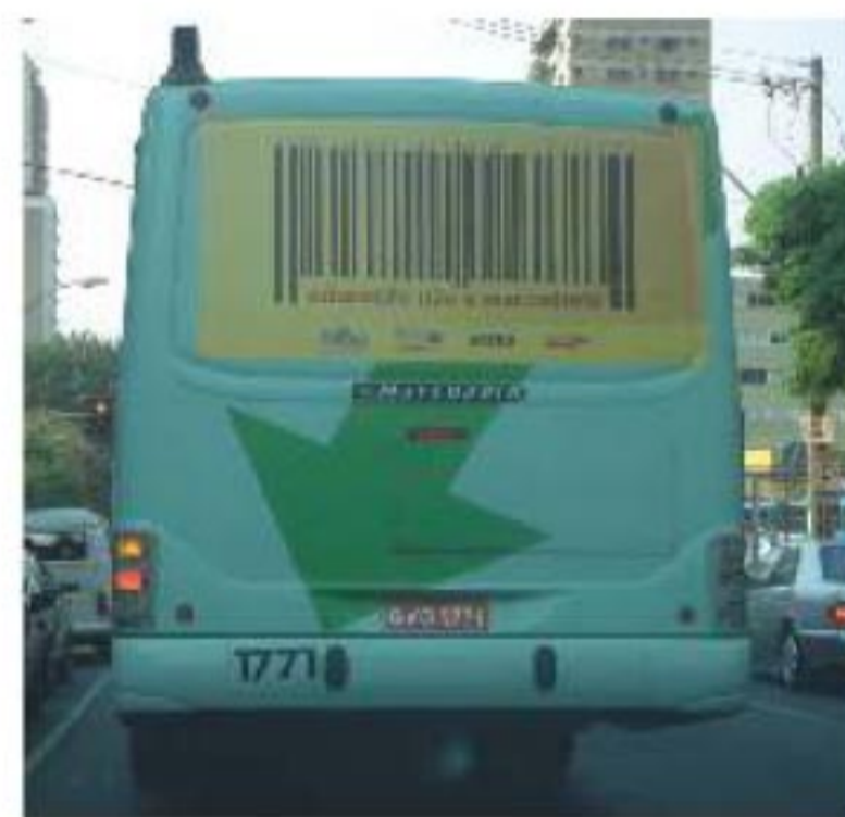
Em BH, ônibus exibem a campanha.

Em Minas Gerais, a regulamentação do setor privado e a democratização do Conselho Estadual de Educação foram as principais reivindicações apresentadas pelos participantes da audiência pública, realizada no dia 3 de outubro, na Assembléia Legislativa de Minas Gerais, que discutiu a Campanha “Educação Não é Mercadoria” no Estado. Após o lançamento, o Sinpro Minas intensificou a divulgação da Campanha em outdoors e spots nos principais veículos de televisão do Triângulo Mineiro e de Ponte Nova. De lá para cá, cartazes, adesivos e panfletos foram distribuídos em escolas e universidades e 50 veículos de várias linhas de ônibus circularam durante trinta dias pelas principais ruas e avenidas da região metropolitana de Belo Horizonte, com a imagem da Campanha na parte traseira.