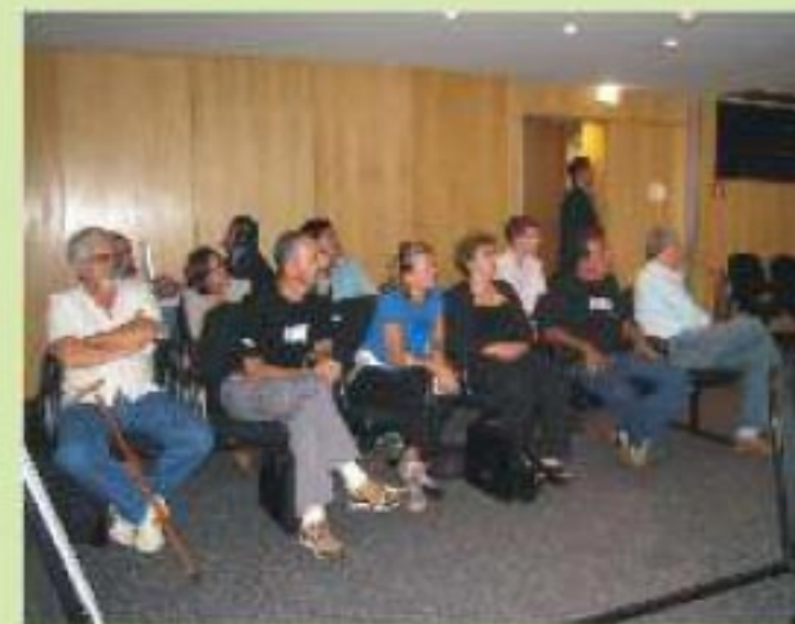
Diretoria executiva da CONTEE prestigia a apresentação da Campanha ao Conselho Federal da OAB